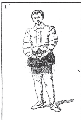
POSA DI FRONTE