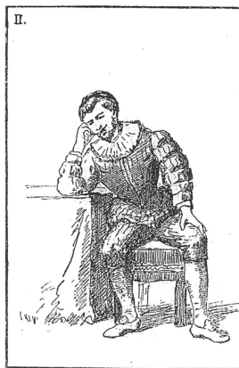
POSE DE FACE