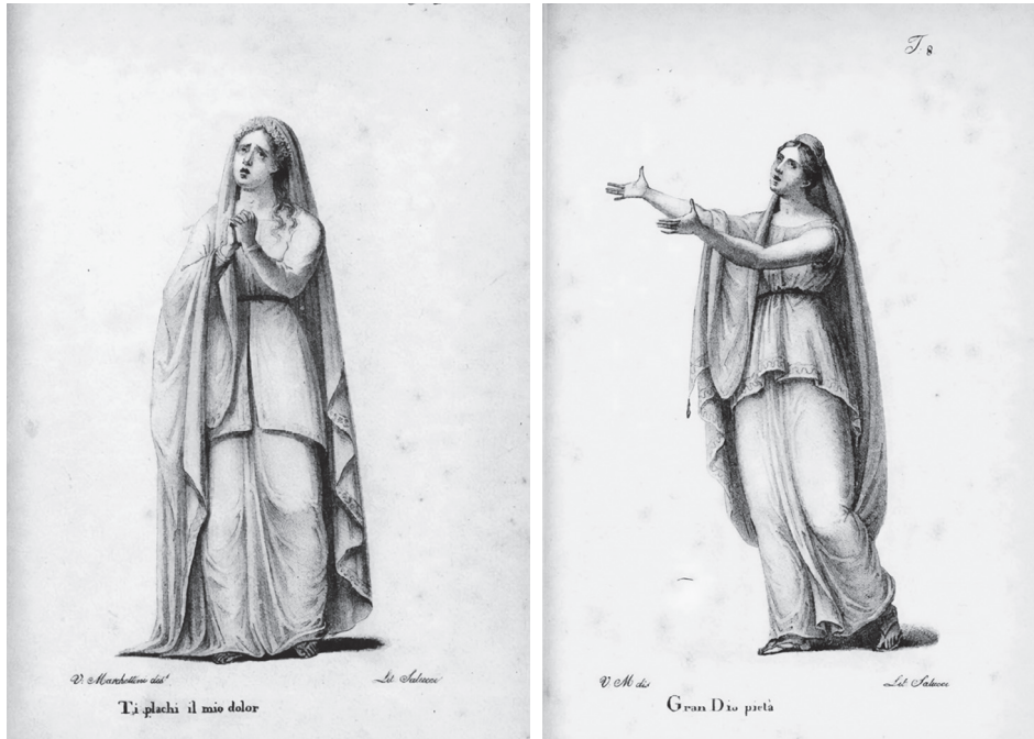
Fig. 1 & 2. Antonio Morrocchesi, Lezioni di declamazione e d'arte teatrale , Firenze 1832, Lezione VIII, fig. 1 «Ti plachi il mio dolor», e fig. 8 «Gran Dio pietà»

il cambiamento risulta già evidente, per esempio, nel trattato di arte teatrale di Antonio Morrocchesi del 1832, che insiste palpabilmente sulla centralità della voce in quanto fatto acustico. L'autore vi costruisce un percorso didattico in crecendo (sempre più 'musicale') che, partendo dalla voce in sé (Lezione I) e passando attraverso l'articolazione (Lezione II) e la pronuncia (Lezione III), approda alla declamazione (Lezione IV). Da qui, a tu per tu col problema della tragedia, parte la successione delle lezioni dalla quinta alla dodicesima, che trattano nell'ordine l'enfasi, le pause, i 'tuoni' per approdare infine a cinque lezioni che toccano, nell'ordine, i sentimenti, la mimica, la gestualità. 46 L'ottava lezione («Del muover gli affetti») si apre così, ormai, a una nuova prospettiva, che risulta anche da due figure, riferite al personaggio di Ermengarda, che illustrano uno degli affetti che ci interessano (Figg. 1 e 2).