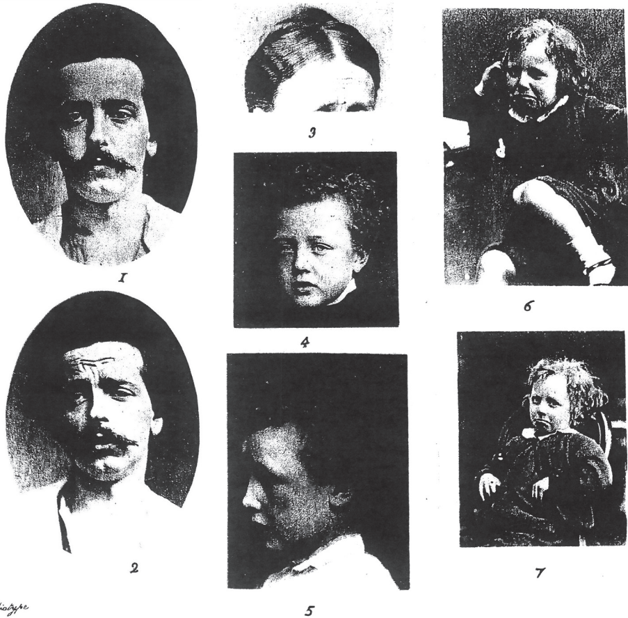
Fig. 3. Charles Darwin, L'espressione delle emozioni nell'uomo e nell'animale (1872), a cura di Gian Arturo Ferrari, Torino 1982, cap. VII, «Depressione, ansietà, afflizione, scoraggiamento, disperazione», figg. 1-7

che esige uno scandaglio del sé in quanto individuo. A questo proposito possiamo allora aggiungere che negli anni del cinema muto delle origini quella personalizzazione in teatro diventerà estrema, fissandosi anche come metodo (con Stanislavskij) e correndo non per caso parallela alle prime acquisizioni psicoanalitiche.