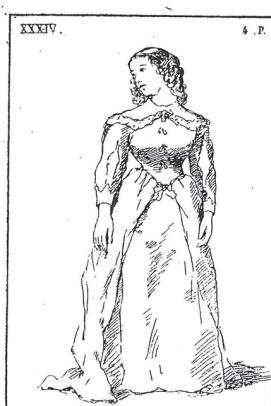
Fig. 6. Enrico Delle Sedie, Estetica del canto , pp. 29, 57 e 58