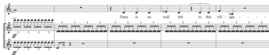
Abb. 8: Lament of the Frontier Guard , T. 54–58

Der ganze Beginn steht stellvertretend für die von Johnston in den 1950er Jahren benutzte neoklassizistische Sprache. In starkem Kontrast hierzu folgt ab Takt 43 ein chromatisches Kontinuum der ersten Geige, begleitet von gezupften Quartern und Quinten in der zweiten. Das Geschehen beruhigt sich wiederum nur scheinbar in einem Unisono auf d' (Abbildung 8).