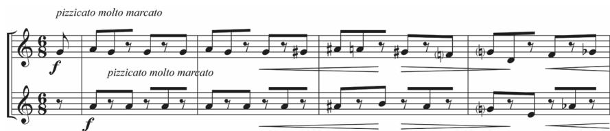
Abb. 6: Lament of the Frontier Guard , T. 1–4

Hauptsächlich in Sekundschritten kreist Johnston 11 Takte um das a' , bevor er die beiden Violinen in drei Anläufen aufs e''' führt. Auf Takt 22 setzt ein neuer, mit »rhapsodic« bezeichneter Formteil ein, der mit seinem heiter-trotzigen Charakter an osteuropäische Tanzmusik erinnert. Auf einen raumgreifenden rhythmischen Impuls folgt über mehrere Takte eine fallende Linie im Diminuendo (Abbildung 7).