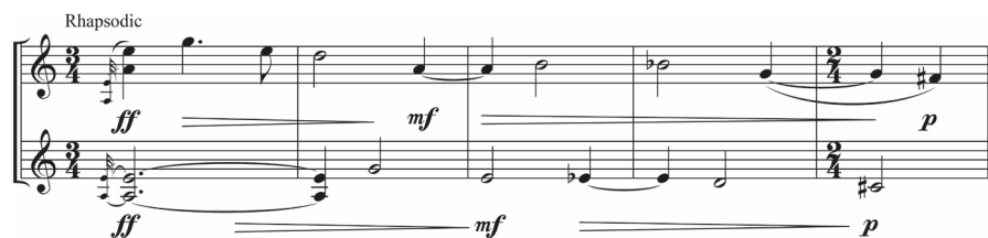
Abb. 7: Lament of the Frontier Guard , T. 22–26

Hauptsächlich in Sekundschritten kreist Johnston 11 Takte um das a' , bevor er die beiden Violinen in drei Anläufen aufs e''' führt. Auf Takt 22 setzt ein neuer, mit »rhapsodic« bezeichneter Formteil ein, der mit seinem heiter-trotzigen Charakter an osteuropäische Tanzmusik erinnert. Auf einen raumgreifenden rhythmischen Impuls folgt über mehrere Takte eine fallende Linie im Diminuendo (Abbildung 7).