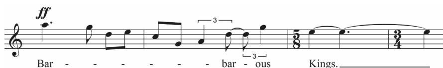
Abb. 10: Lament of the Frontier Guard , T. 73–76

Wichtiger als die unterschiedliche Übersetzung scheinen mir aber technische Aspekte zu sein, insbesondere die divergierende Behandlung der Stimme. Die unbegleiteten Stellen sind zwar metrisch notiert, animieren in ihrer Schlichtheit aber, sich rhythmische Freiheiten zu nehmen. Zudem ist der Ambitus der Stimme in diesen Passagen meist sehr eingeschränkt. In der Verbindung dieser beiden Aspekte kommen diese Abschnitte dem mikrointervallischen Sprechgesang Partchs zumindest nahe. Andererseits finden sich mehrere Stellen im Duktus der Zweiten Wiener Schule, mit großen Intervallen und Melismen (Abbildung 10).