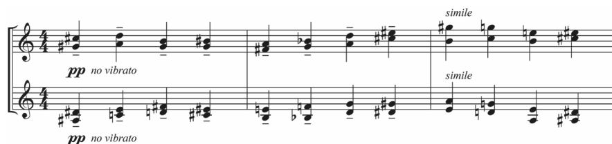
Abb. 9: Lament of the Frontier Guard , T. 106–108

Die durchgehenden Achteltriolen vermitteln eine große innere Unruhe, die sich nach diesem energetischen Tiefpunkt erneut entlädt, hin zum zweiten Auftreten der Rhapsodie in Takt 74. Auf das letzte Erscheinen des Themenkopfes setzt in der ersten Violine ein hoher Triller ein, der acht Takte anhält und zur endgültigen Beruhigung führt. Auf »And sorrow, sorrow like rain« beginnt der Sopran solistisch den resignierten Schlussteil. Erst hier passt die Stimmung zum Text. Auf die drittletzte Zeile setzen die Violinen mit einem neuerlichen Trauermarsch in durchgehenden Vierteln ein. Beide Instrumente spielen dabei stets Doppelgriffe in Terzen, Quarten und Quinten. Der durchgehend vierstimmige Satz unterscheidet sich mit seinen Sekundreibungen deutlich vom Trauermarsch im zweiten Lied (Abbildung 9).