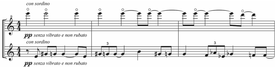
Abb. 3: Taking Leave of a Friend , T. 1–3

Johnston reichert im weiteren Verlauf die Melodie mit Sekunden an, den einfachen Duktus eines Trauermarsches behält er in den Violinen aber während des ganzen Stücks bei – »In Stillness and Space«, 33 als würden sich die beiden Freunde schon voneinander entfernen. Durch die Stimmführung in extrem weiter Lage wird diese Trennung dann auch akustisch erfahrbar gemacht.