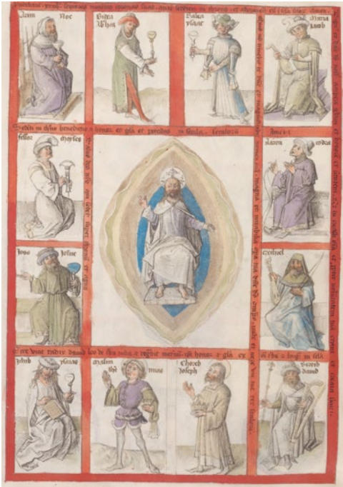
Abb. 7 Anonymus, Die Anbetung der Majestas Domini durch die 24 Ältesten , Lille und Ninove, 1460, Pergament, 408 x 286 (304 x 215) mm, in: Lambert 1460, fol. 11v (mit freundlicher Genehmigung der KB Den Haag – Nationalbibliothek der Niederlande).