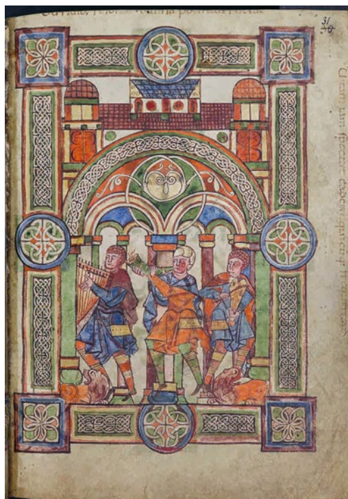
Abb. 4a/b Anonymus, König David und seine Musiker, Soignies (Hennegau), 3. Drittel des 11. Jahrhunderts, Pergament, 270 x 195 mm, in: MsC, fol. 30v–31r.