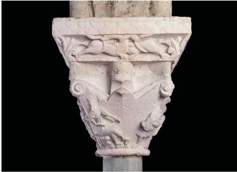
Abb. 1 Anonymus, König David und seine Musiker , um 1100, Sandstein, Moissac, Abbaye Saint-Pierre, Kreuzgang (Foto: Roberto Sigismondi. Mit freundlicher Genehmigung des Kunsthistorischen Instituts in Florenz – Max-Planck-Institut).