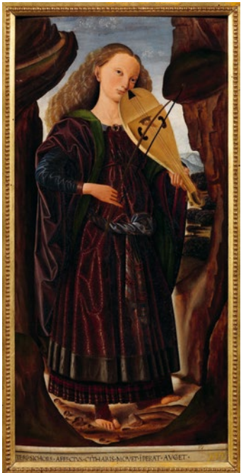
Abb. 9 Giovanni Santi, Die Muse Terpsichore , ca. 1480/90, Öl auf Holz, 82,7 x 39,8 x 0,88 cm, Florenz, Galleria Corsini (Foto: Claudio Giusti. Mit freundlicher Genehmigung der Galleria Corsini – Firenze).