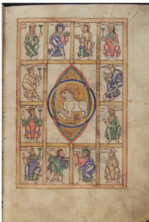
Abb. 5a/b Anonymus, Die Anbetung der Majestas Domini und des Lammes durch die 24 Ältesten , Nordfrankreich, Flandern oder Hennegau, drittes Viertel des 12. Jahrhunderts, Pergament, 435 x 295 mm, in: Lambert o. J.a, fol. 10v–11r.