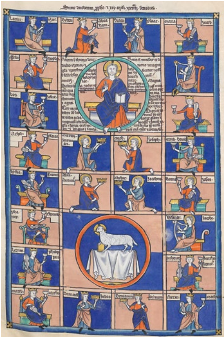
Abb. 6 Anonymus, Die Anbetung der Majestas Domini und des Lammes durch die 24 Ältesten , Nordfrankreich, drittes Viertel des 12. Jahrhunderts, Pergament, 465 x 295 mm, in: Lambert o. J.b, fol. 35r.