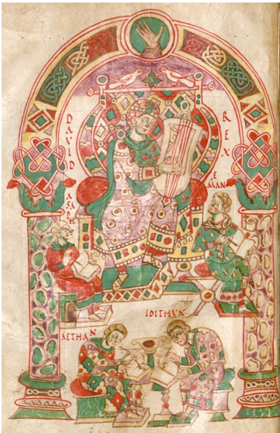
Abb. 2 Anonymus, König David und seine Musiker , Mailand, letztes Drittel 10. Jahrhundert, Federzeichnung und Deckfarben auf Pergament, 200 x 130 mm (Folio 250 x 175 mm), in: PsaltAmb , fol. 12v.