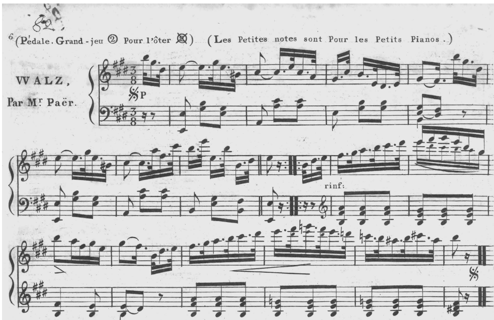
ABBILDUNG 2 Beginn des Walzers von Ferdinando Paër aus Recueil de walzes ... [1814] mit kleinen Ossia-Noten für ältere Klaviere mit nur fünftaktigem Tonumfang

Damit wird der Kreis der potentiellen Subskribentinnen und Subskribenten auch auf diejenigen ausgedehnt, die noch kein modernes größeres Klavier besitzen.