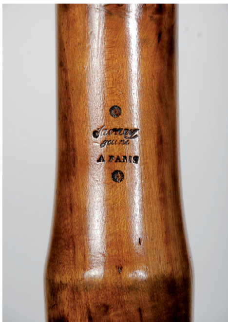
Savary-Fagott aus der Sammlung des Musikwissenschaftlichen Instituts der Universität Tübingen