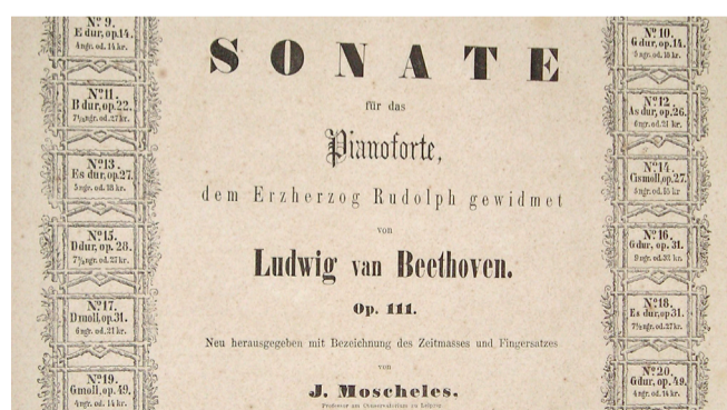
In Moscheles' verschiedenen Ausgaben spiegelt sich auch die Entwicklung von Klavierbau, sozialen Voraussetzungen und pianistischer Technik. Deutsche Ausgabe bei Hallberger, c. 1857, Frontispiz.