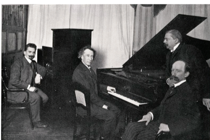
Welte-Mignon-Aufnahmesitzung mit Emil von Sauer. Scan aus dem Firmenkatalog von 1906.

Die konstruktiv bedingten Zufälligkeiten des Welte-Abspielvorgangs gehören wesentlich zur beabsichtigten «Aura» dieses Wiedergabegeräts. Die Virtualisierung entzieht dem Instrument diese Art der «Authentizität» schrittweise, dafür werden die gespeicherten musikalischen Informationen im quellenkritischen Sinn belastbar. Solch präzise historische Informationen zu Parametern wie Dynamik oder Pedalgebrauch sind nur in diesen Interpretationsdokumenten greifbar. Ebenfalls lässt die Klärung des Dynamiksystems darauf hoffen, dass der bis jetzt nur ungenügend dokumentierte Aufnahmeprozess besser verstanden werden kann, da hier zum ersten Mal statistisch relevante Untersuchungen der Befehlshäufigkeit in verschiedenen Repertoires möglich werden.