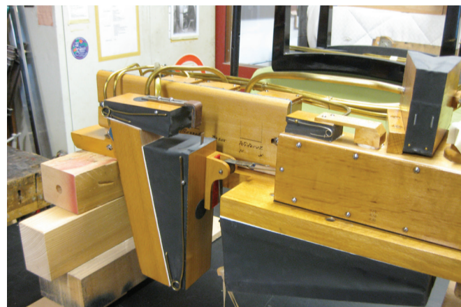
Dynamiksteuerung des Welte-Mignon-Flügels. Werkstatt Heinrich Sulzener.