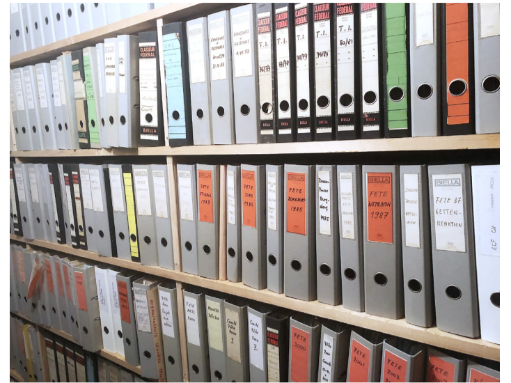
Tonkünstlerfeste, Wettbewerbe und Tourneen, fein säuberlich dokumentiert.