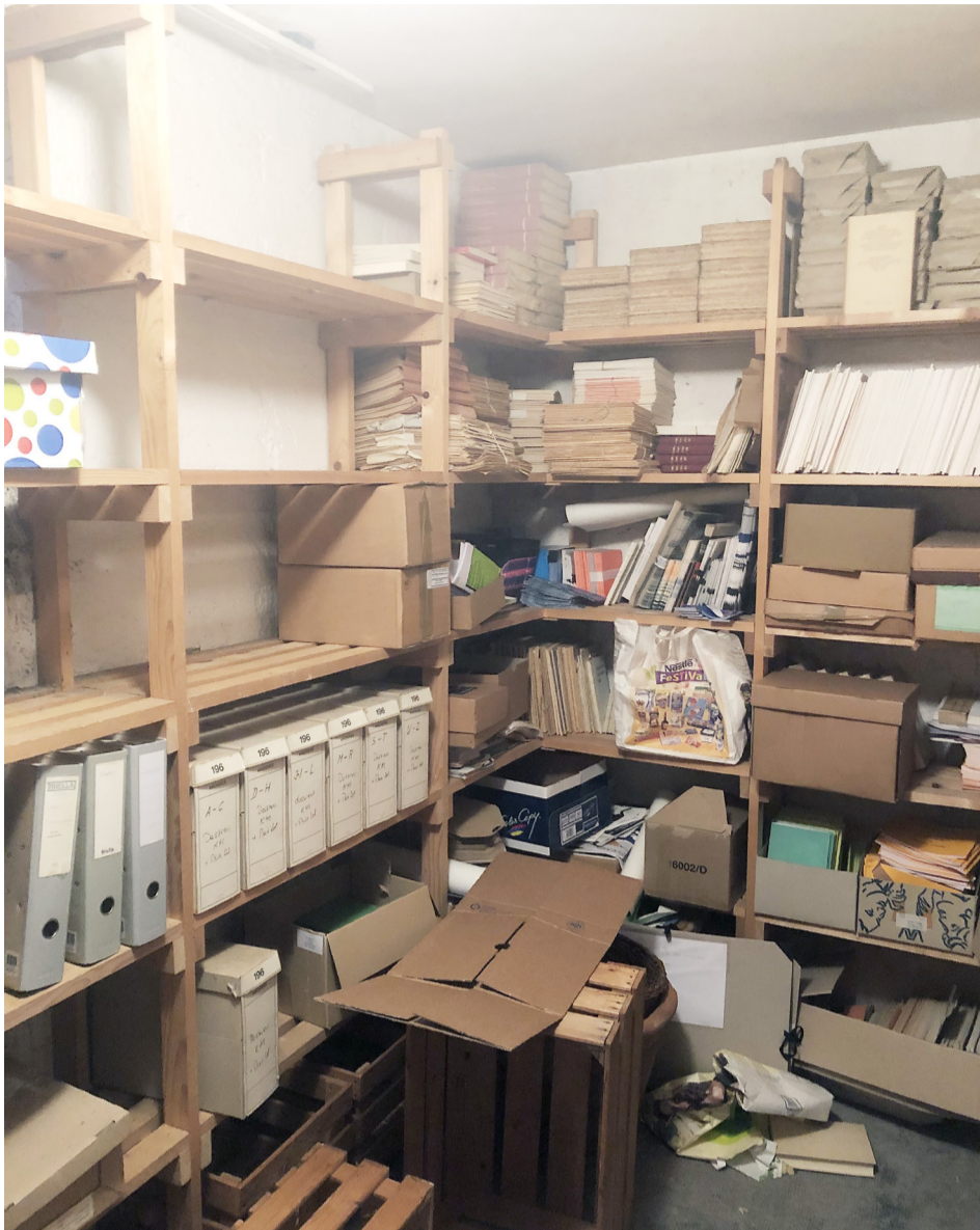
Unterschiedlichste Materialien harren ihrer Aufarbeitung: Blick in eine Kellerecke des STV-Archivs in Lausanne.